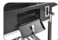
Θύρα τροφοδοσίας κάρβουνου