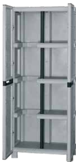
Με 3 ράφια και χώρο για σκούπα