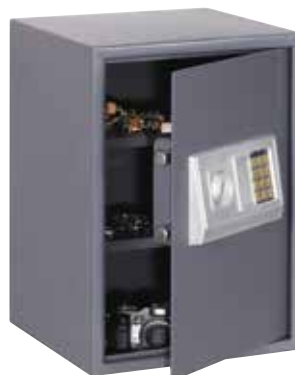
ΚΩΔ. 631307 HS-500E