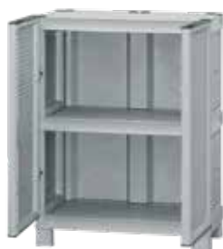
Με 1 ράφι