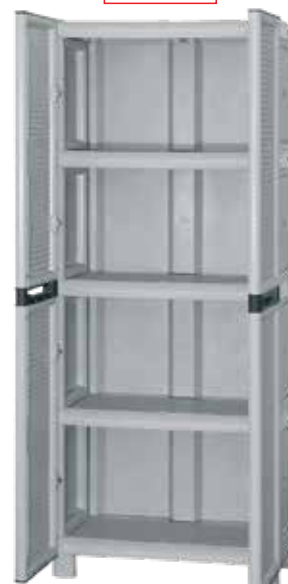
Με 3 μεγάλα ράφια