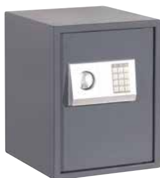
ΚΩΔ. 631306 HS-430E