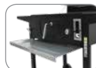
Συρτάρι συλλογής στάχτης