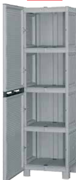
Με 3 ράφια