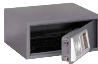
ΚΩΔ. 631304 HS-350E