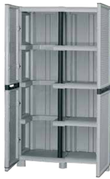
• Με 3 ράφια και χώρο για σκούπα • Μεγάλοι χώροι