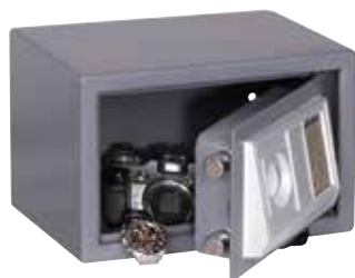
ΚΩΔ. 631301 HS-200E