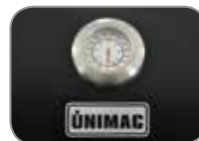
Καπάκι με θερμομέτρο INOX