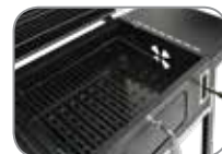
Διάτρητη πλάκα εμαγιέ με 6 ρυθμιζόμενες θέσεις ύψους