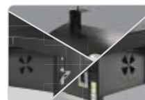
Με ρυθμιστές ροής αέρα στο θάλαμο καύσης