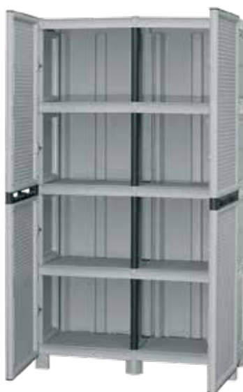
• Με 3 ράφια • Μεγάλοι χώροι