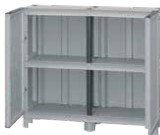
Με 1 ράφι