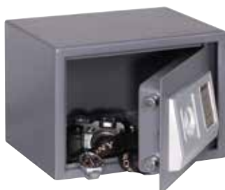
ΚΩΔ. 631302 HS-250E