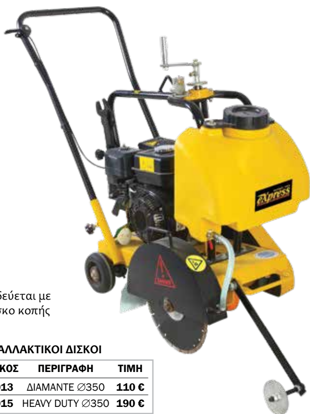
Συνοδεύεται με το δίσκο κοπής