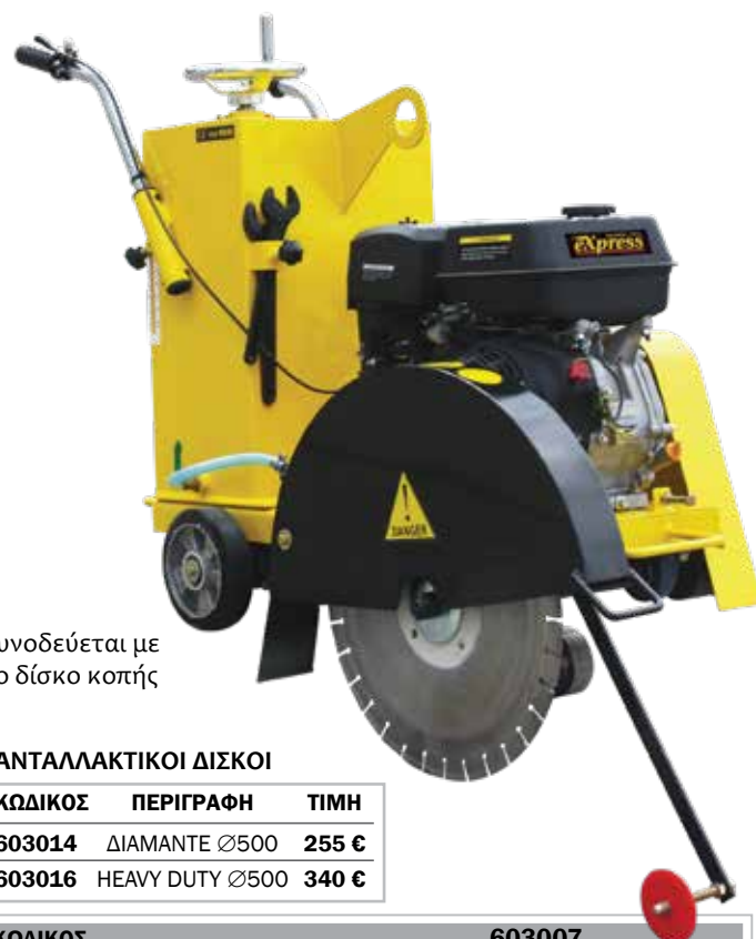
Συνοδεύεται με το δίσκο κοπής