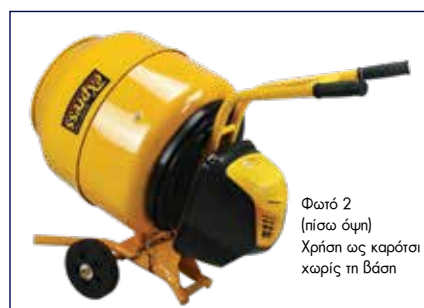
Φωτό 2 (πίσω όψη) Χρήση ως καρότσι χωρίς τη βάση