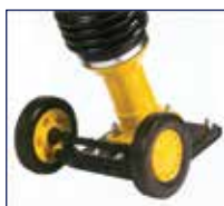
Συνοδεύεται με κит τροχών