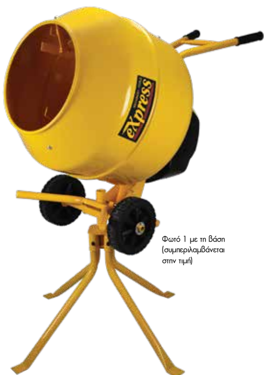
Φωτό 1 με τη βάση (συμπεριλαμβάνεται στην τιμή)

✓ Τροχήλατες μπετονιέρες 135 και 160 Lt. που μπορούν να χρησιμοποιηθούν και σαν καρότσι για τη μεταφορά του υλικού