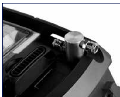
Υποδοχή για σύνδεση με εργαλεία αέρος