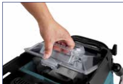
Σακούλα πολλαπλών χρήσεων