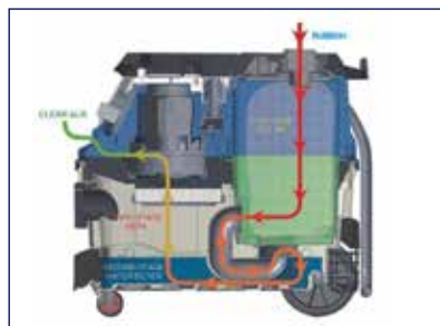
Σύστημα τριπλού φιλτραρίσματος