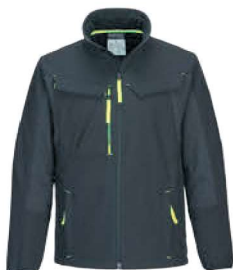
T753 388,₺ ΜΠΟΥΦΑΝ WX3 ECO HYBRID SOFTSHELL (2L)