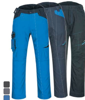
T711 443 ΠΑΝΤΕΛΟΝΙ WX3 SERVICE