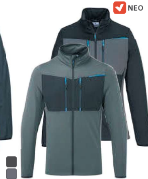
T756 409 NEO ΕΞΕΙΔΙΚΕΥΜΕΝΟ ΦΛΙΣ ΜΕ ΦΕΡΜΟΥΑΡ WX3