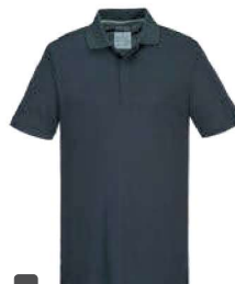
T722 495,₺ ΜΠΛΟΥΖΑ ΠΟΛΟ ECO S/S