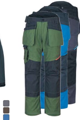
T702 442 ΠΑΝΤΕΛΟΝΙ WX3 HOLSTER