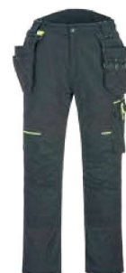
T706 442,₺ ΕΛΑΣΤΙΚΟ ΠΑΝΤΕΛΟΝΙ WX3 ECO HOLSTER