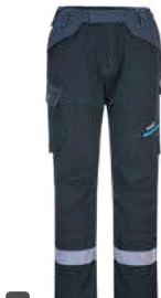
FR402 261,₺ ΠΑΝΤΕΛΟΝΙ WX3 FR SERVICE