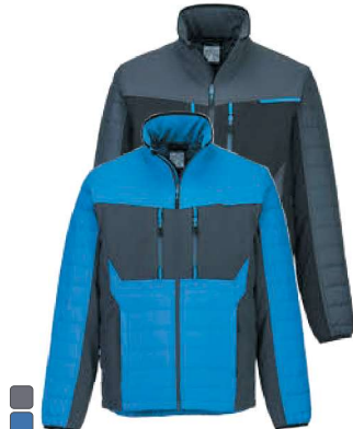
T752 402 WX3 HYBRID BAFFLE ΜΠΟΥΦΑΝ