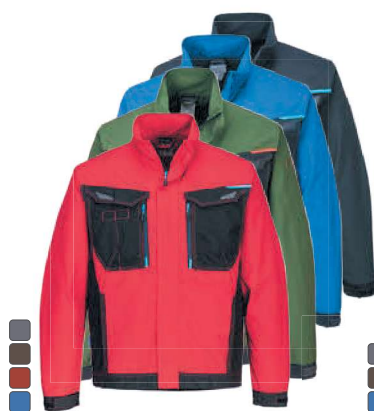
T703 441 WX3 ΣΑΚΑΚΙ ΕΡΓΑΣΙΑΣ