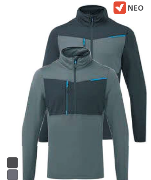
T755 409 NEO ΕΞΕΙΔΙΚΕΥΜΕΝΟ ΦΛΙΣ WX3 HALF ZIP