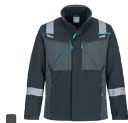
FR704 247,₺ SOFTSHELL WX3 FR