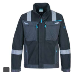
FR602 261,₺ ΜΠΟΥΦΑΝ ΕΡΓΑΣΙΑΣ WX3 FR