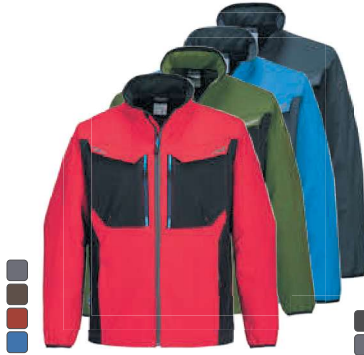
T750 388 SOFTSHELL ΜΠΟΥΦΑΝ WX3