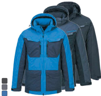
T740 360 WX3 ΧΕΙΜΕΡΙΝΟ ΜΠΟΥΦΑΝ