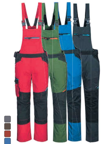
T704 443 ΦΟΡΜΑ ΤΙΡΑΝΤΑ WX3