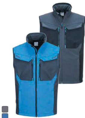
T751 394 WX3 SOFTSHELL ΠΛΕΚΟ (3L)