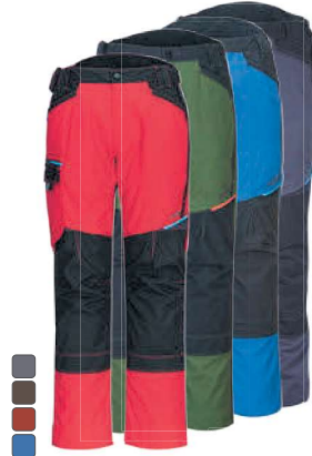
T701 441 ΠΑΝΤΕΛΟΝΙ WX3