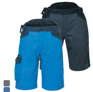
T710 443 WX3 ΣΟΡΤΣ