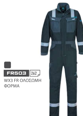
FR503 262,₺ WX3 FR ΟΛΟΣΩΜΗ ΦΟΡΜΑ