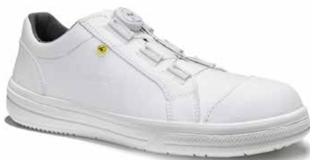
BOA® Fit System