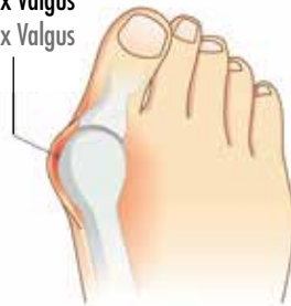
Hallux Valgus Hallux Valgus