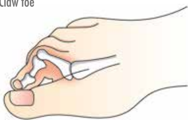
Krallenzehe Claw toe